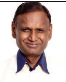
ਉਦਿਤ ਰਾਜ ਸੰਸਦ ਮੈਂਬਰ

ਮੁਕੱਦਮੇ ਦੀ ਬਹਿਸ ਤੱਕ ਸਮਝੌਤੇ ਹੀ ਹੁੰਦੇ ਰਹਿੰਦੇ ਹਨ, ਇਸ ਕਰਕੇ ਘੱਟ ਹੀ ਮਾਮਲਿਆਂ ਵਿਚ ਸਜ਼ਾ ਮਿਲ ਪਾਉਂਦੀ ਹੈ। ਜੇਕਰ ਕਬਿਤ ਦੁਰਵਰਤੋਂ ਦੀ ਸਥਿਤੀ ਵਿਚ ਇਹ ਹਾਲ ਹੈ ਫਿਰ ਤਾਂ ਸੁਪਰੀਮ ਕੋਰਟ ਦੇ ਤਾਜ਼ਾ ਫੈਸਲੇ ਤੋਂ ਬਾਅਦ ਇਸ ਕਾਨੂੰਨ ਦਾ ਮਹੱਤਵ ਲੱਗਭੱਗ ਖਤਮ ਹੀ ਹੋ ਜਾਵੇਗਾ।