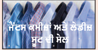
ਜੈਂਟਸ ਕਮੀਜ਼ਾਂ ਅਤੇ ਲੇਡੀਜ਼ ਸੂਟ ਦੀ ਸੇਲ

Toilet Water Pressure (Elite 2 Bio Bider) A budget Friendly solution for your desire to feel exceptionally clean and reduce toilet paper waste Only $ 41.99+Tax