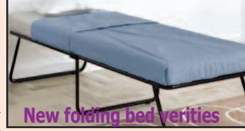
New folding bed varieties

Loose Fabrics, Groceries, Blankets, Vegetables